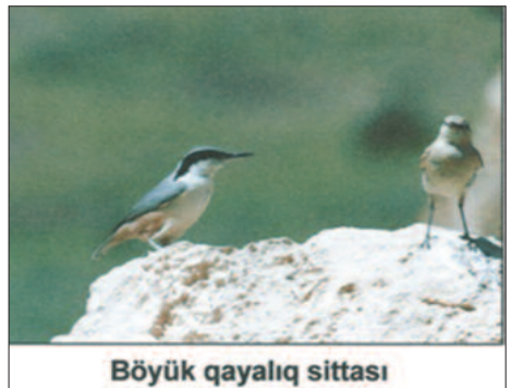
Böyük qayalıq sittası