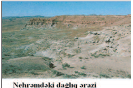
Nehrəmdəki dağlıq ərazi

Bütün bunlar Naxçıvanda müəmmal quş gəzintisinin gözəl nəticəsi idi.