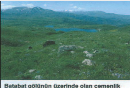
Batabat gölünün üzərində olan çəmənlik

Nahar yeməyindən sonra Bakı şəhərindən Naxçıvana yola düşdük. İki gün burada səfərdə olduq. Səhər erkən ilk hədəfimiz Aladöş çərançı (Radde's Accentor) quşunu görmək idi. Batabat gölünün üzərindəki rəngli yarımalp çəmənliklərini yoxladıqdan sonra oxuyan Aladöş çərançı quşunu gördük və quşun yaxından şəkillərini çəkə bildik. Batabatda gördüyümüz digər quşlar