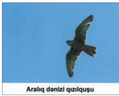
Aralıq dənizi qızılquşu